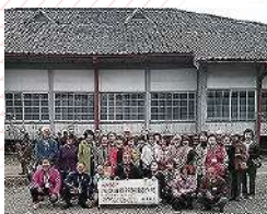
昨年は富岡製糸場