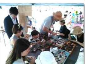
賑わうレーザー加工体験