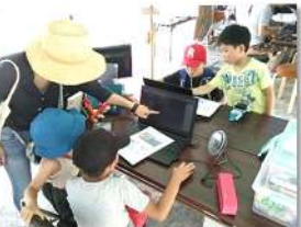
プログラミング体験