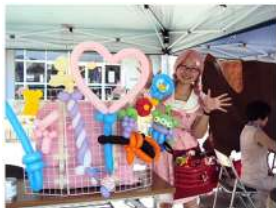
初参加・バルーンアート