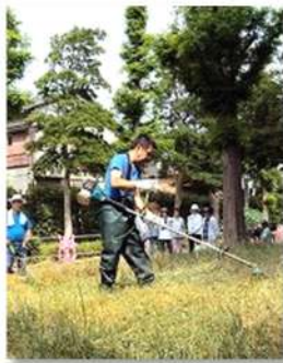
追加導入の除草機の練習

毎月第一日曜日、8時から約1時間、緑地公園の清掃活動ボランティアを行っています。7月は清掃日には、24名もの多数の方が参加。エンジン付きの除草機も新たに1台購入され、2台で威力を發揮しました。大山街道から図書館入り口まで左側。植木の内外側の除草と清掃をしました。