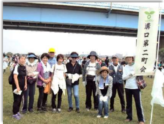
アユも喜んだことでしょう。