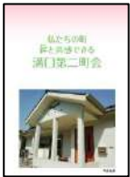
町会のパンフレットは、会館玄関に備付

また、転入者は、ゴミの出し方に困りませう。教えてあげて、合わせて、町会へ加入を勧めてください。