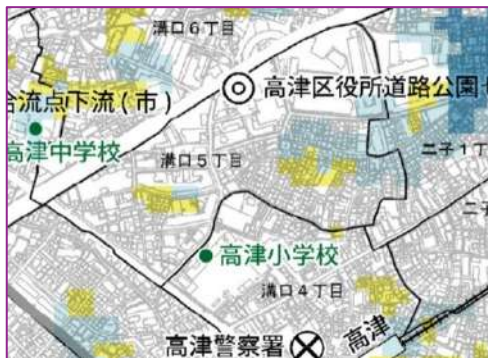
高津区内水ハザードマップ(町会近隣部)

市が作成しました。一昨年の台風十九号の被害の教訓から。町会内は、左図の黄色い地区が、五十cmの冠水が想定されます。