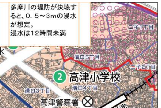
洪水ハザードマップ(高津区版)(多摩川/浸水深)

一方、多摩川の堤防が決壊すると、右図中の洪水が想定されます。万一の場合の避難については、朱線下部の地域は垂直避難です。高津小へは避難しないでください。同上部の方々も、近隣の高層建物等への避難を優先して、密になることを避けてください。当町会内は、土砂崩れの危険がある区域はありません。