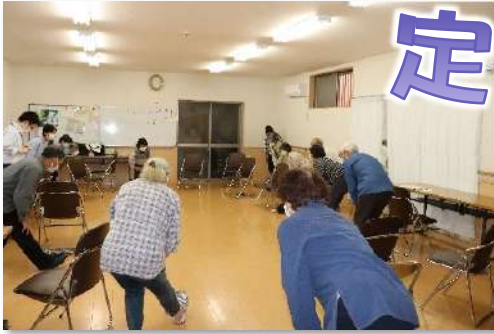
何歳か若返ったかも？