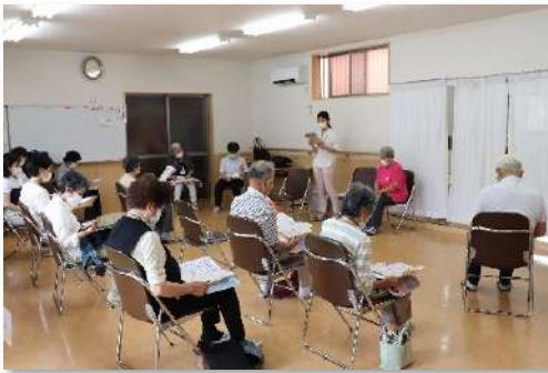
ビンゴで食事のメニューを理解

4月から、毎月第2火曜日の14時からを定例として、町会会館で行われています。無料で参加はご自由です。