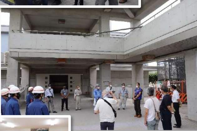
上: 仮設トイレを組み立て 右: 同校を補完する第二町会会館で、水と電気の確保も見学 下: 町会会館での机上訓練