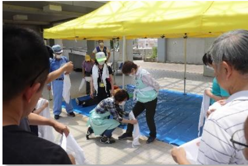
6月25日(日) 溝口6町会保健救護班が訓練

▼浸水は3層 市が作成したハザードマップ(災害地図)では、多摩川の堤防が決壊すると、50センチから3層の浸水が想定されています。冠水は12時間未満。内水は、図の黄色い地域が50センチです。当地区には、土砂崩れ危険箇所はありません。