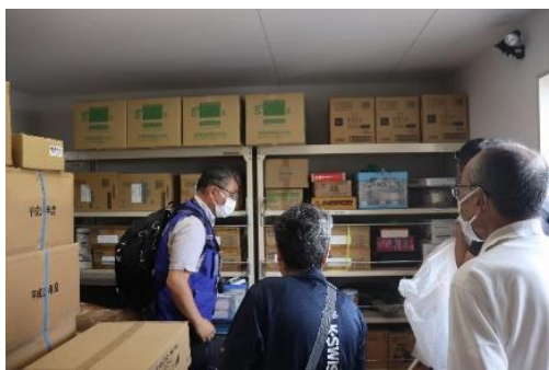
同日、高津小学校庭の備蓄品倉庫を点検

多摩川の堤防が決壊すると、0.5~3mの浸水が想定。浸水は12時間未満 避難は2階等へ垂直避難 家屋倒壊想定区域 2 高津小学校 高津警察署