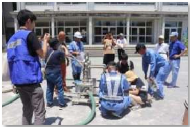
試薬で水質を検査

6月22日(日) 10:30から、高津小学校で行われました。参加は、溝口第一町会から南町会までの6町会長、町会ごとに選出された環境衛生班員と施設物資班員、学校長、学務主任、PTA会長、市下水道局、区危機管理担当と、同校近隣にお住いの市職員の方々。