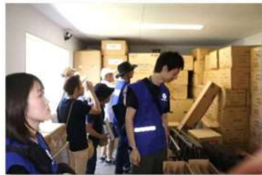
備蓄倉庫内を探る

機材を取り出し、マンホールのフタを開けて給水口、吸排気弁を確認、蛇腹ホースに接続して水をくみ上げます。